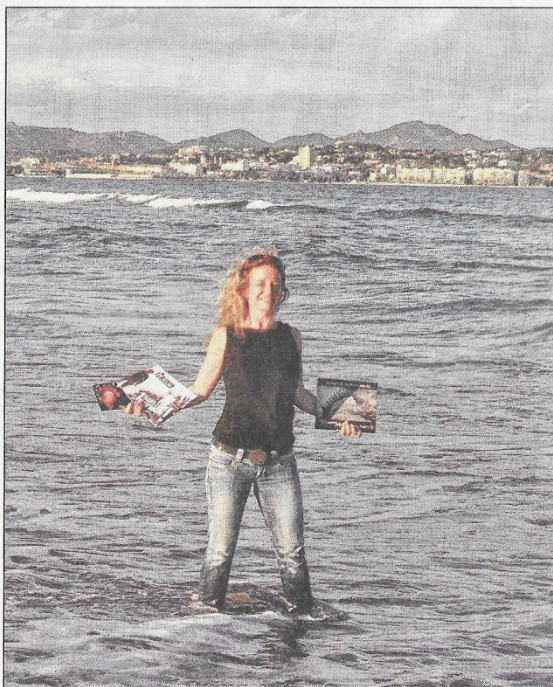
L'artiste pose sur sa plage fétiche de Fréjus avec certaines de ses publications. On retrouvera la photographe au Clos des roses de 2 au 28 juin.

Au fil des cimes, le public pourra découvrir 24