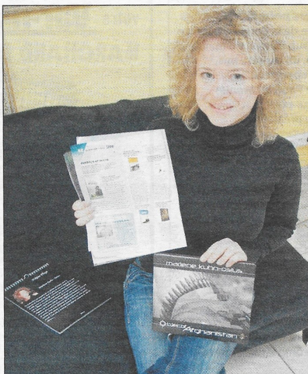
« Objectif Afghanistan » a été élu livre du mois par le magazine « TIM ».

Aujourd'hui, la jeune Allemande, a conçu un calen-