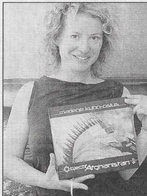
« Objectif Afghanistan » de la photographe Marlene Kuhn-Osius vient de sortir.

De plus, sur l'invitation du colonel du 21 e Régiment, elle va certainement partir en Afghanistan prendre des clichés des soldats au cœur de l'action, qui feront l'objet d'un second ouvrage. Les yeux brillants de satisfaction, la belle Allemande se prépare également à l'élaboration d'un livre plus personnel, une sorte d'invitation à la méditation traduit