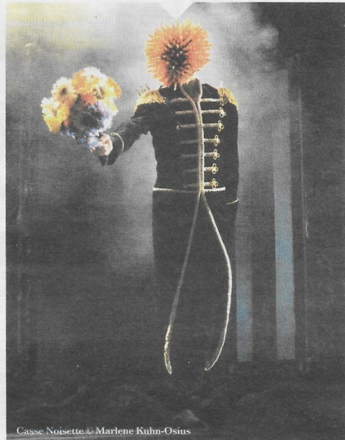
Casse Noisette © Marlène Kuhn-Osius